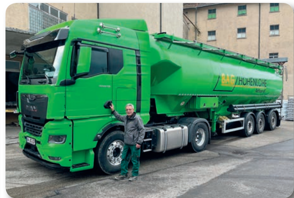
Seit 33 Jahren für Sie unterwegs: Horst Berroth